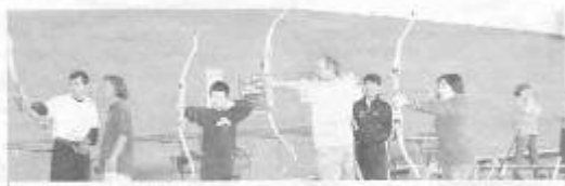
Les tireurs au pas de tir

■ Les archers audengeois, nouvelle association audengeoise vient d'inaugurer son pas de tir à l'ancienne salle des sports de Pessalle. Pour le premier après-midi, plus d'une vingtaine d'archers sont venus découvrir ce nouveau sport à Audence. Créer depuis quelques mois seulement, ce nouveau club compte déjà dix adhérents et s'est affilié à l'UFOLEP, devenant ainsi le troisième club affilié à cette fédération en Gironde, avec Bègles et Saint-Selve. Du fait de cette affiliation, il est fortement question que le championnat départemental de tir à l'arc se déroule à Audence.